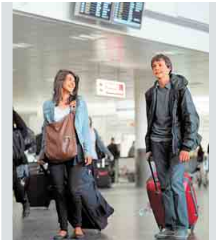
■ Αεροδρόμιο Γκάτγουικ, Λονδίνο. Επιτέλους... σπίτι για το νεαρό ζευγάρι της φωτογραφίας

ηφαιστειακή τέφρα, καθώς αναμέναμε ότι θα ερχόταν στην Ελλάδα σε μεγαλύτερα υψόμετρα. Επειτα από διεξοδική επεξεργασία των μετρήσεων και επιβεβαίωση των μετεωρολογικών δεδομένων, μπορούμε με σιγουριά να πούμε ότι τα σωματίδια που ανιχνεύουμε σε υψόμετρο 2.000 - 3.000 στον Αττικό ουρανό προέρχονται από το ισλανδικό ηφαίστειο ύστερα από πορεία τεσσάρων - πέντε ημερών. Μάλιστα, από τις μετρήσεις προκύπτει ότι τα σωματίδια τέφρας κατεβαίνουν σε κατώτερα στρώματα, εισέρχονται στον αναπνεύσιμο αέρα του Λεκανοπεδίου και επικαθονται στο έδαφος. Πα' όλα αυτά, οι συγκεντρώσεις της τέφρας είναι σε αρκετά χαμηλά επίπεδα και ως εκ τούτου δεν υπάρχει λόγος ανησυχίας για τη δημόσια υγεία. Εκτι-